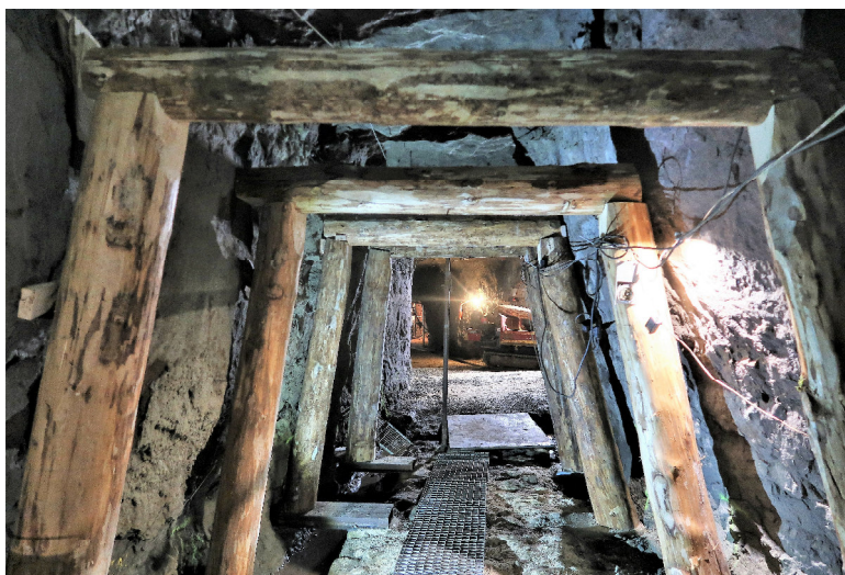
Bergwerkstollen wie einst.