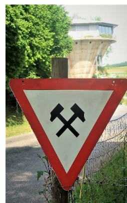
Dieses ungewöhnliche Verkehrssignal hat Seltenheitswert.

weilen auf dem Gleisende bei der Werkhalle aufgestellt; später wird es den Stollen bereichern.