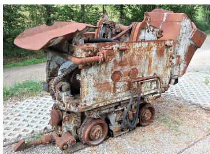
Aus Bergwerkszeit: Überkopflader.

DER ÜBERKOPFLADER – auf den ersten Blick ein etwas seltsames Gerät – ist in Bergwerken eingesetzt worden, insbesondere bei engen Platzverhältnissen. Ob ein solcher Bagger, auch als Wurfschaufellader bezeichnet, in den Herznacher Stollen im Einsatz war, darüber streiten sich die VEB-Geister. Wie dem auch sei, es ist ein tolles Geschenk des Schweiz. Vereins der Feldbahnfreunde in Otelfingen. Herzlichen Dank! Das Gerät ist einst-